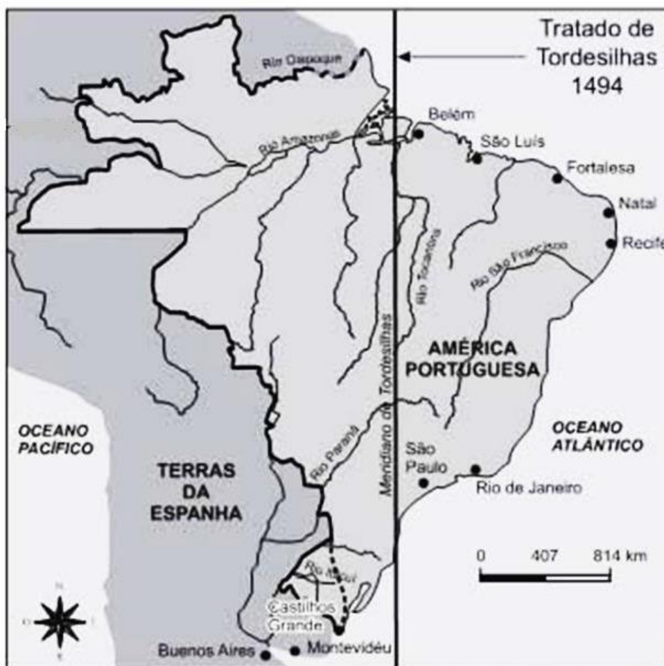
Figura 1: Representação da divisão de terras, onde hoje é o Brasil, entre portugueses e espanhóis, de 1494. Tratado de Tordesilhas