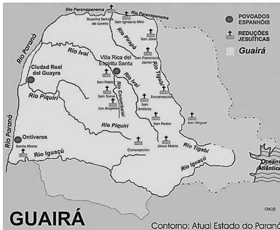
Figura 2: Mapa da Província do Guairá no século XVII, com contorno das atuais limitações do estado do Paraná e localizações dos povoados espanhóis e reduções jesuíticas.